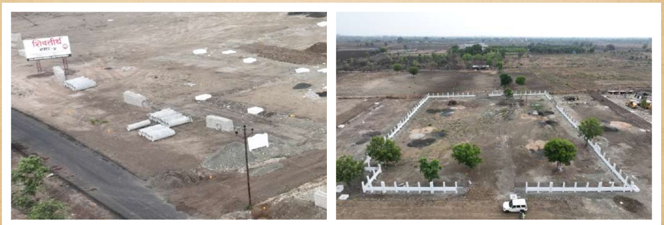
Location: Zari, Besa-Pawtha Road, Nagpur.