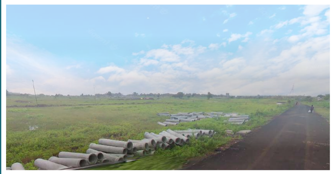
Location: Near VCA Stadium, Jamtha, Nagpur.